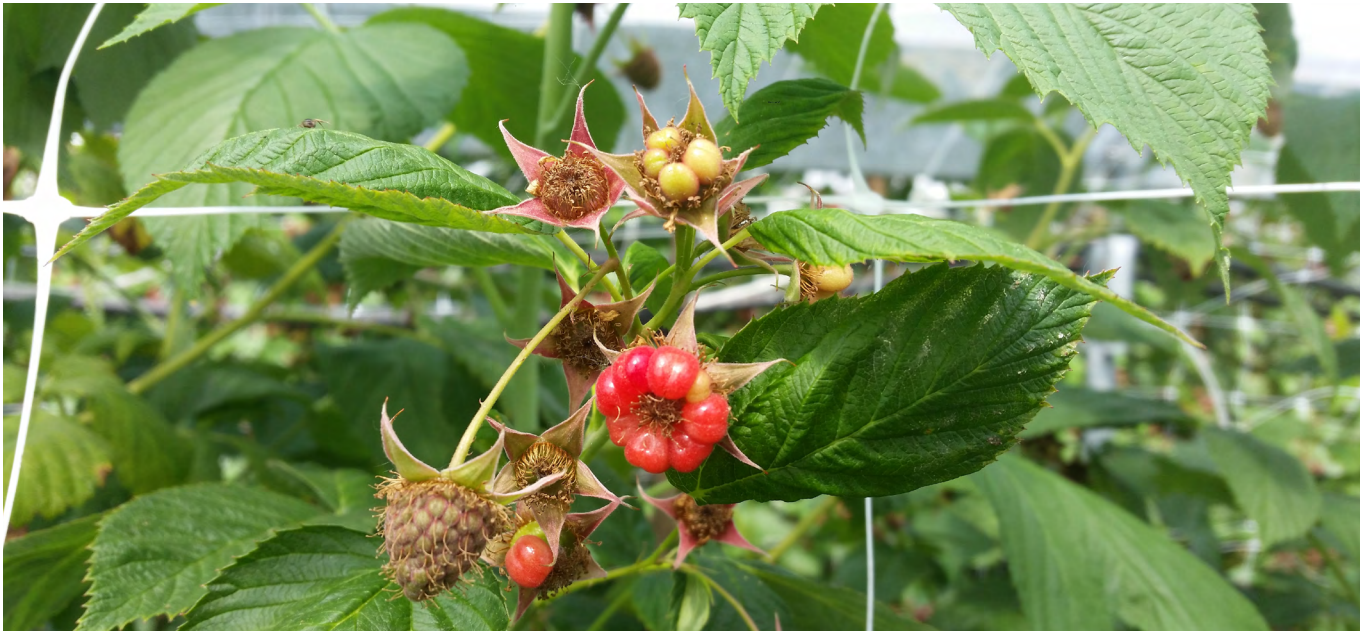
Ausgesperrte Bestäuber führen zu kümmerfrüchten.