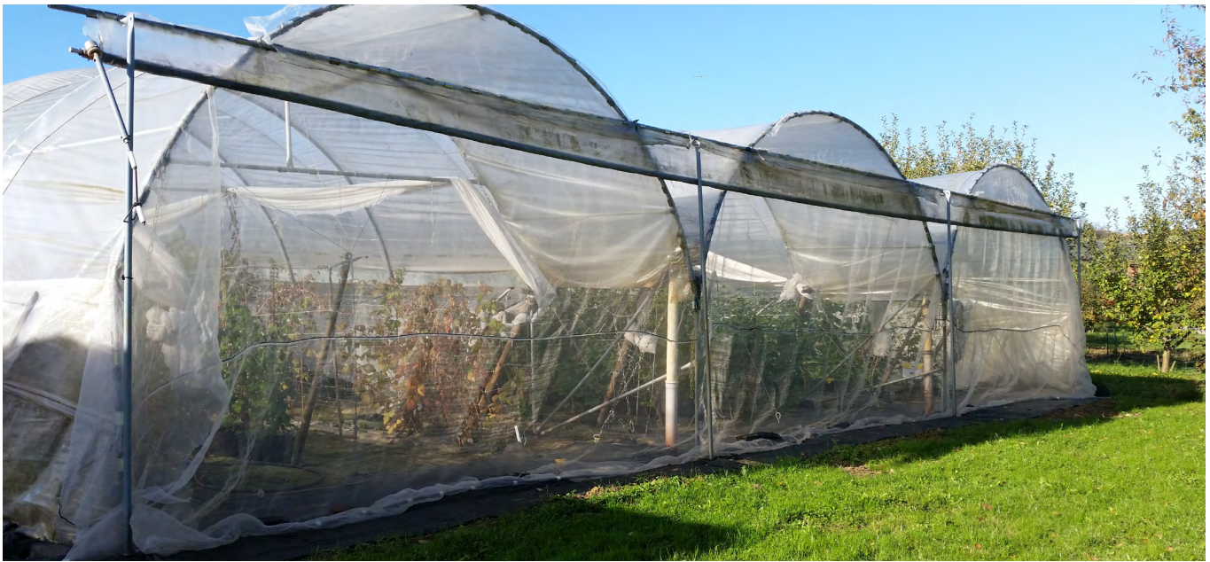
Einnetzungsvariante: Himbeeren im Folientunnel mit eingetzten Stirnseiten