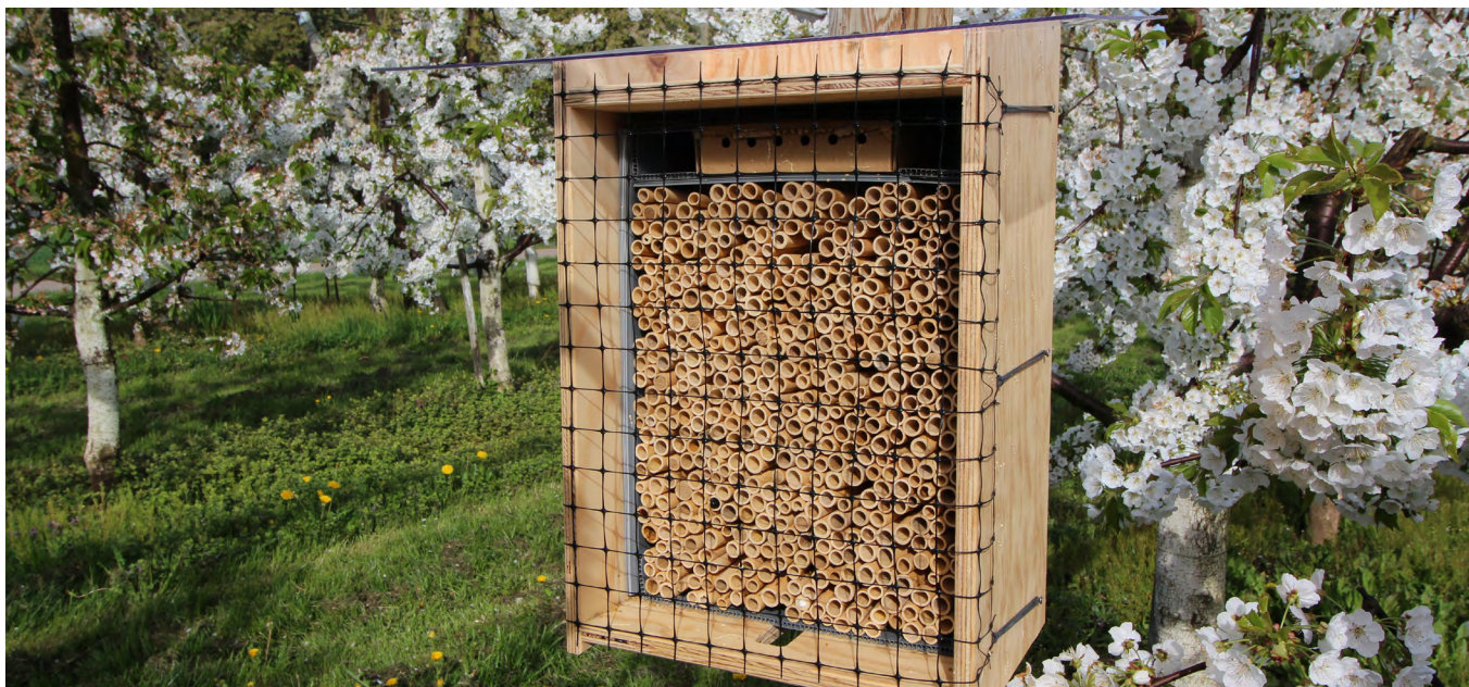
Nisthilfen können in geschützten Anlagen dagegen Abhilfe schaffen.