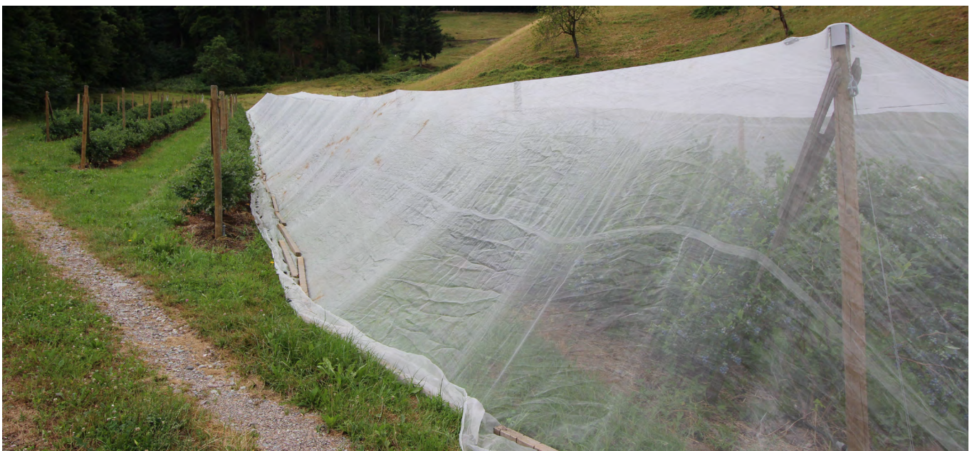
Einnetzungsvariante: vollständig eingetetzte Heidelbeeranlage

Das Befahren und Begehen vollständig geschlossener Tunnel oder eingetzter Anlagen mit Überdachung ist für Pflanzenschutz- oder Kulturmaßnahmen sowie zur Ernte unvermeidlich. Durch das regelmäßige Öffnen kann die Kirschessigfliege